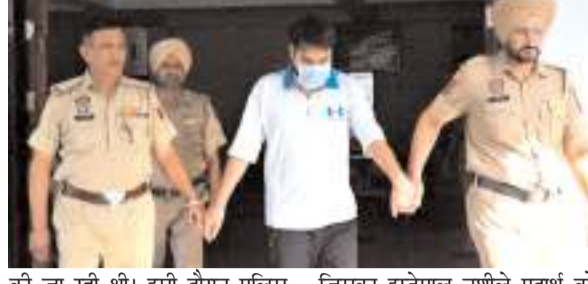
बलटाना में वेलवेट क्लार्क होटल के पास नाकाबंदी दौरान पकड़ा गया आरोपी, इलेक्ट्रॉनिक कंडा भी बरामद; पहले भी दर्ज है कई मामले