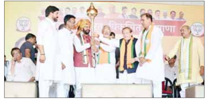
रोहतक को मैट्रो से नहीं जोड़ पाया तो 2029 का चुनाव नहीं लड़ूंगा: शर्मा

नायब सैनी ने कहा कि 2014 में भाजपा सरकार बनने के बाद पारदर्शी सिस्टम लागू हुआ और युवाओं को मैरिट के आधार पर नौकरियां मिल रही हैं। कर्मचारियों के तबादले ऑनलाइन किए जा रहे हैं। उन्होंने कहा कि भाजपा की डबल इंजन सरकार ने 10 सालों में गरीब, किसान, युवा आदि