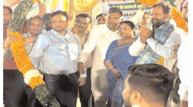
अर्थ प्रकाश संवाददाता