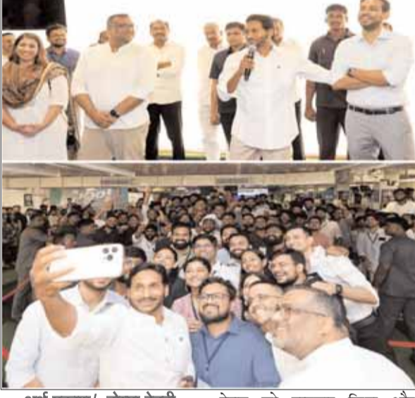
अर्थ प्रकाश/, बोम्मा रेड्डी

नई दिल्ली। आंध्र प्रदेश के हाल में हुए 2024 के चुनाव में वाईएसआर पार्टी को 175 सदस्यीय आंध्र प्रदेश विधानसभा चुनाव में 98 से 99 सीटें जीतने का अनुमान है। विपक्षी टीडीपी गठबंधन 72-76 सीटों के साथ पीछे रहने की उम्मीद है। सर्वेक्षण की रिपोर्ट सोशल मीडिया प्लेटफॉर्म पर व्यापक रूप से साझा की जा रही है। इसके अलावा भी कई सोशल मीडिया के प्लेटफॉर्म ने 128 से 136 के बीच वाईएसआर पार्टी जीतने की संभावना बताया था। यह विपक्षी घटक दलों के लिए एक बड़ा झटका है क्योंकि सत्ता में वापस आने की उनकी उम्मीद नाकाम हो गई है। अत्यधिक ज्यादा पोलिंग डेटा से पता चलता है कि वाईएसआर पार्टी ने गांवों में अधिक वोट हासिल किया है, जबकि टीडीपी ग्रामीण मतदाताओं का विश्वास जीतने में विफल रही है इसके अलावा आंध्र प्रदेश के तेलुगु देशम पार्टी वाईएसआर की योजनाओं को ग्रामीण क्षेत्र में क्षेत्र में दुष्प्रचार किया था यहां तक का दल की अब आंध्र प्रदेश श्रीलंका जैसे विक्रि जाएगी ठीक 1 साल के बाद जब 2024 में चुनाव का मौका आया तो वही वाईएसआर पार्टी के योजनाओं को इन्होंने भी अपने मेनिफेस्टो में जोड़ दिया इससे लोगों के लिए उक्त मेनिफेस्टो मजाकिया लगा और नकल मेनिफेस्टो का बड़ा जोशल मीडिया में प्रचार हुआ तथा जिस योजनाओं को आंध्र प्रदेश में लागू की गई उन योजनाओं पर भारतीय जनता पार्टी ने पहले तेलुगु