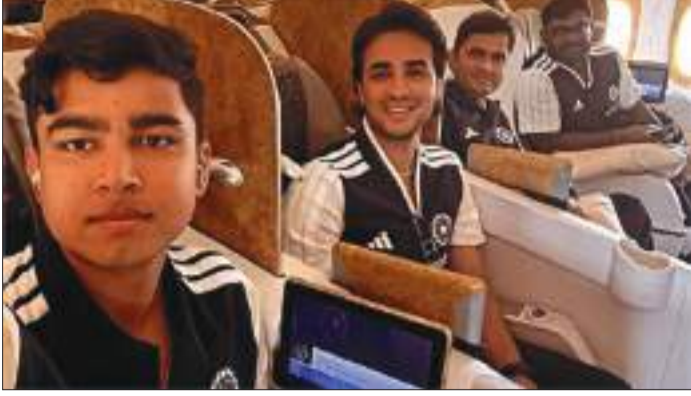
रही है, खासकर इसलिए क्योंकि 2028 में न्यूजीलैंड में अगला मेन्स टी20 वर्ल्ड कप होने लांस एंजिलस ओलंपिक और ऑस्ट्रेलिया और

इस साल की शुरुआत में टी20 वर्ल्ड कप जीतने के बाद आयरलैंड में होने वाले टी20आई मैच भारत के लिए पहली सीरीज होगी। भारत 26 और 28 जून को डबलिन में दो टी20आई खेलेगा। टी20आई टीम की कप्तान श्रेयस के स्थान में होने से भारत के लिए सबसे छोटे फॉर्मेट में एक नए अध्याय की शुरुआत हो