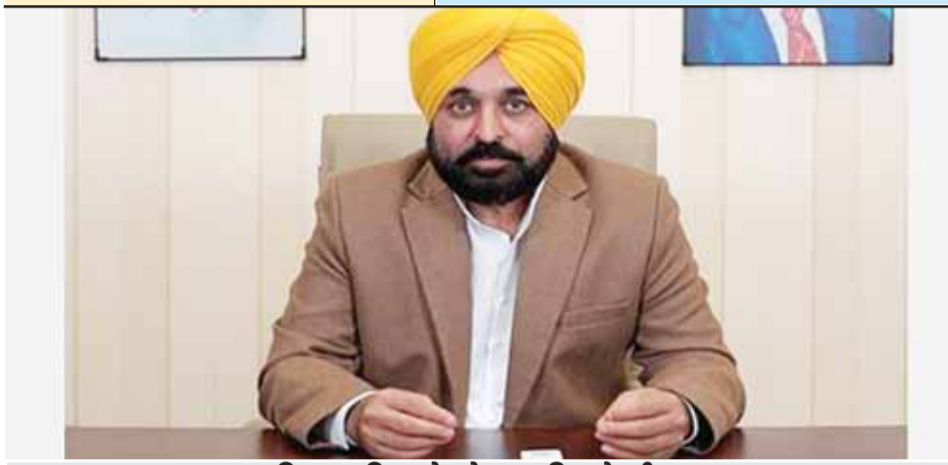
97 प्रतिशत महिलाओं को लाभ मिलने की संभावना

● सभी श्रेणियों की महिलाओं को 1,000 रुपए प्रति माह और अनुसूचित जाति की महिलाओं को मिलेंगे 1,500 रुपए प्रति माह