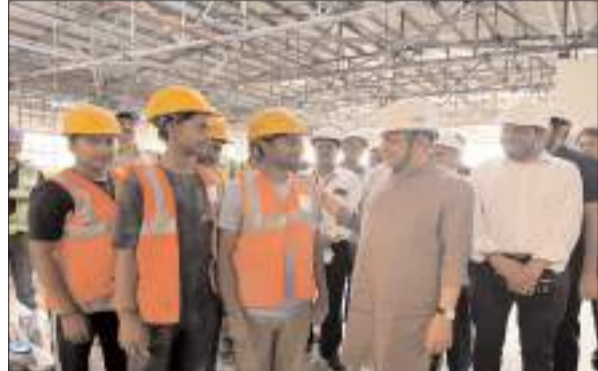
दौरान आने वाली परेशानियों को लेकर विस्तृत चर्चा की। कामगार की रक्षा पर रेल मंत्री का त्वरित एक्शन इस दौर का सबसे भावुक और

दिल्ली। आज माननीय रेल मंत्री ने गुड़गांव रेलवे स्टेशन का औचक निरीक्षण किया। इस दौरान उन्होंने स्टेशन पर चल रहे विश्वस्तरीय पुनर्विकास (Redevelopment) कार्यों की प्रगति का बारीकी से जायजा लिया और अधिकारियों को आवश्यक दिशा-निर्देश दिए। इस स्टेशन का पुनर्विकास कार्य 300 करोड़ की लागत से किया जा रहा है। निरीक्षण के दौरान रेल मंत्री ने हमेशा की तरह जमीन से जुड़े नेतृत्व का परिचय देते हुए स्टेशन पर मौजूद यात्रियों से सीधा संवाद किया। उन्होंने यात्रियों से रेलवे की सेवाओं, उनके अनुभवों और यात्रा के