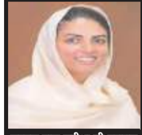
सद्गुरु माता सुदीक्षा जी महाराज

परिवार वालों ने। मानवता का संदेश देने वाले, ज्ञान दृष्टि प्रदान करने वाले एक ही निराकार के भक्त हों तो इससे बढ़कर क्या धर्म होगा? मानवता का