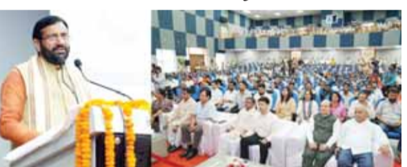
कुरुक्षेत्र भारत की आध्यात्मिक चेतना का केंद्र

कुरुक्षेत्र, 5 जून-हरियाणा के मुख्यमंत्री नायब सिंह सैनी ने कहा कि योग हमारी सनातन संस्कृति का वह अनमोल उपहार है, जो हमारे ऋषियों-मुनियों ने पूरी मानवता के कल्याण के लिए दिया है। भारत की हजारों वर्षों पुरानी योग परंपरा आज पूरी दुनिया के लिए प्रेरणा का स्रोत बन चुकी है। एक समय था जब योग केवल आश्रमों और गुरुकुलों तक सीमित माना जाता था, लेकिन आज विश्व के लगभग हर देश में योग किया जा रहा है। यह भारत की सांस्कृतिक शक्ति का प्रमाण है।