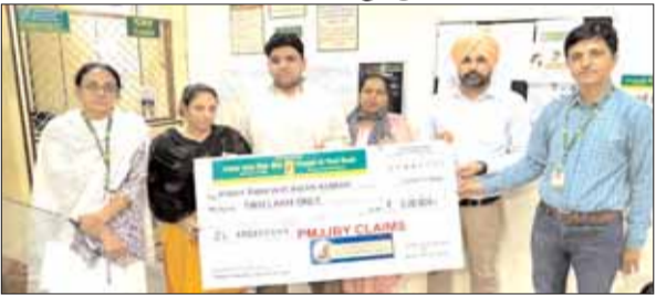
अर्थ प्रकाश संवाददाता