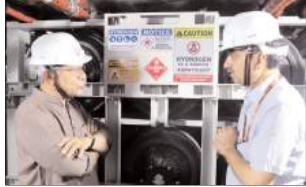
भूमिका निभा रहा है। इस निरीक्षण के दौरान उत्तर रेलवे के महाप्रबंधक (GM), दिल्ली मंडल के रेल प्रबंधक (DRM) और रेलवे बोर्ड व उत्तर रेलवे के अन्य वरिष्ठ अधिकारी भी उपस्थित रहे।

रेलवे' का संकल्प आज 'विश्व पर्यावरण दिवस' के विशेष अवसर पर माननीय रेलमंत्री ने डिपो परिसर में आयोजित एक कार्यक्रम में भाग लिया और पौधरोपण किया। इस अवसर पर उन्होंने पर्यावरण संरक्षण के प्रति भारतीय रेल को दृढ़ प्रतिबद्धता को दोहराया। उत्तर रेलवे और संपूर्ण भारतीय रेल वर्तमान में शत-प्रतिशत विद्युतीकरण (100% Electrification) की ओर तेजी से अग्रसर है, जो देश को 'नेट-जीरो कार्बन उत्सर्जक' (Net-Zero Carbon Emitter) बनाने के राष्ट्रीय संकल्प को पूरा करने में महत्वपूर्ण