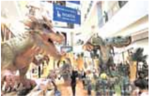
अर्थ प्रकाश संवाददाता

5 जून से परिवारों के लिए एनिमेट्रॉनिक ड्रैगन, एआर/वीआर एडवेंचर और वीकली आर्ट वर्कशॉप्स का अनोखा अनुभव